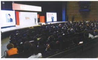
▲熊本城ホールで開かれた「BNIナショナルカンファレンス2023」。国内外から約1100人のメンバーが集まった