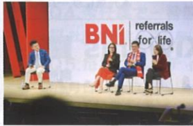
▲BNI香港&BNIマカオのナショナルディレクターによるパネルディスカッション