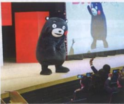
▲くまモンもサプライズで登場