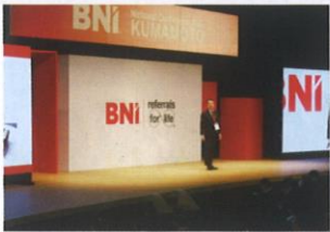
▲メンバーシェアストーリーや基調講演により全国のメンバーが実践報告